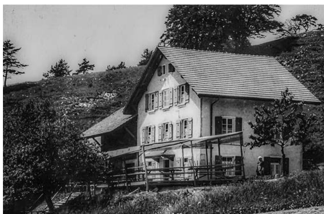
Das Wohnhaus 1935.

Aus einer anderen Chronik ist zu entnehmen, dass im Jahre 1858 auf der Roggenweide bereits ein Weidstall gestanden ist. Dieser wurde jedoch im Verlaufe der Jahre durch mehrere Brände zerstört, so dass immer wieder neu gebaut werden musste. Die Gemeinde, die sich über die schlechte Rendite beklagte, liess 1895 erneut einen Neubau erstellen. Der Hof wurde in der Folge nicht mehr verpachtet, sondern man stellte einen Hirten an. Die Pachtgebühr für ein Rind betrug zwischen 25 und 30 Franken pro Sömmerungssaison. Der Hirt erhielt drei Franken pro Tag und durfte für sich zwei Ziegen halten. Während der Sömmerung befanden sich rund 40 bis 50 Rinder auf der Weide.