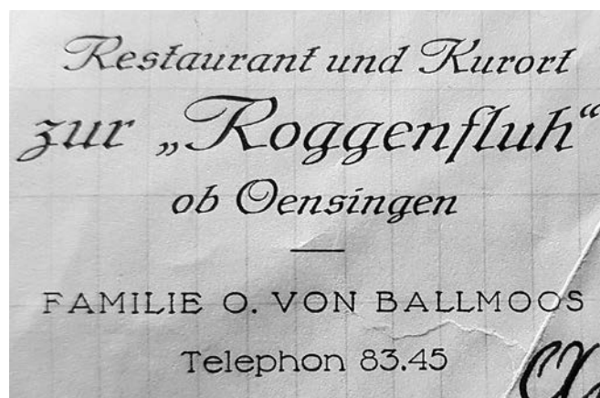
Reklame der ersten Pächterfamilie.

Speziell gross war das Interesse für die neue Pacht ab dem Jahr 1936. Nicht weniger als 27 Bewerbungsschreiben trafen im Jahr zu-