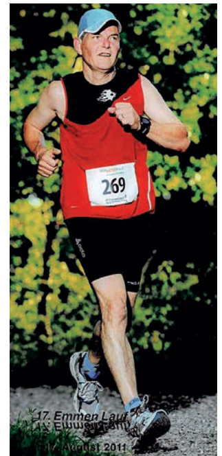
...und 2011 mit 62 Jahren den Emmenlauf.