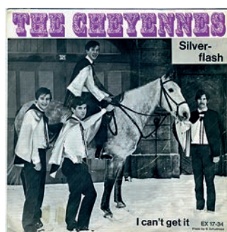
Später, der Musikstil der Jugend hat sich geändert, war es die Band «The Cheyennes», die sich 1967 mit dem Stück «Silver Flash» auf einer Schallplatte in der Oensinger Musikgeschichte verewigte.