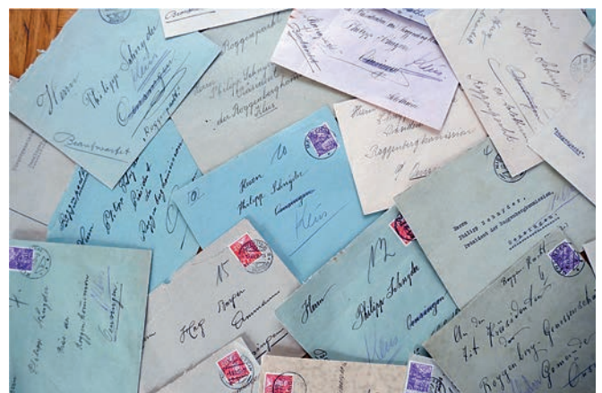
... aus der ganzen Schweiz ein.

vor bei der damaligen Roggen-Kommission ein. Die Poststempel auf den Kuverts zeigen, dass sich Interessenten aus der ganzen Schweiz meldeten: drei aus Oensingen und drei weitere aus dem Kanton Solothurn und zwölf aus dem Kanton Bern, aus den Kantonen Aargau, Baselland und Zürich je zwei und je eine aus den Kantonen Appenzell, Tessin, Waadt und Baselstadt. Der gebotene Pachtzins war mit Beträgen zwischen 3'700 und 5'000 Franken sehr unterschiedlich.