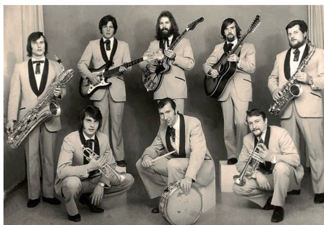
Unvergesslich sind die Auftritte des Orchesters «Pitt Herold», das in verschiedenen Besetzungen überregionale Erfolge feiern konnte.