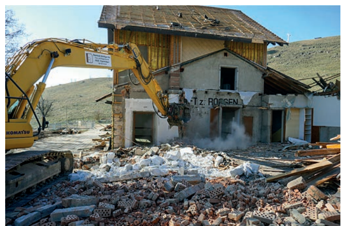
Beim kürzlich erfolgten Abriss ist die frühere Hausanschrift sichtbar geworden.

Die wiederkehrenden Neu- und Umbauten haben auf dem Roggen über all die Jahrzehnte viel Geld verschlungen. Belief sich die Gesamtsumme bis zirka 1983 um 350'000 Franken, so dürfte in den letzten 38 Jahren zusätzlich ein grösserer Betrag in den Roggen gesteckt worden sein. Laufend mussten an dem in die Jahre gekommenen Gebäude Reparaturen vorgenommen und Mängel notdürftig geflickt werden. Überalterte Technik, schlechte Lüftung, zu kleine und nicht mehr den heutigen Anforderungen entsprechende Küche, zu alte und nicht behindertengerechte sanitäre Anlagen – dies nur ein Teil der Schwachstellen in diesem Haus.