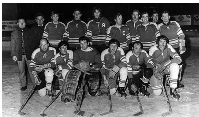
SC Oensingen Eishockeyclub Oensingen damals

Vogelherdclubs zählen. Der Berglauf gehört der Jura Top-Tour an und ist der drittälteste Lauf bei diesem Wettbewerb. Am 12. September 2021 führt der Vogelherdclub die 36. Ausgabe durch.