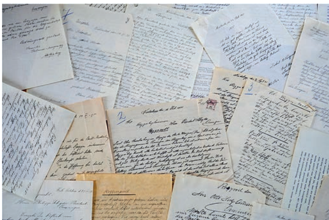
1935 gingen 27 Bewerbungsschreiben für die Pacht ...