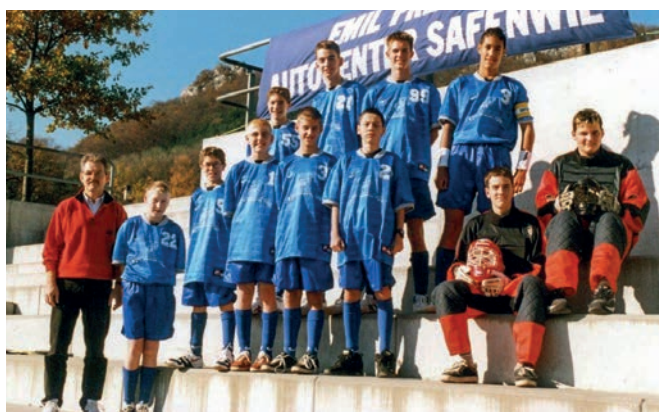
SC Oensingen Lions, die erste Unihockeymannschaft

Vogelherdclubs zählen. Der Berglauf gehört der Jura Top-Tour an und ist der drittälteste Lauf bei diesem Wettbewerb. Am 12. September 2021 führt der Vogelherdclub die 36. Ausgabe durch.