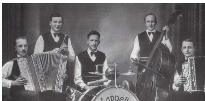
1931 wurde die Kapelle «Meiglöggli» gegründet. Drei Jahre später entstand die erste bekannte Tonaufnahme von Oensinger Musikern.