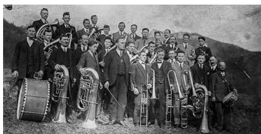
Anfangs des 20. Jahrhunderts gab es drei Musikgesellschaften, die Harmonie, die Concordia und die Arbeitermusik. Diese schlossen sich im 1992 zur Musikgesellschaft Oensingen zusammen.