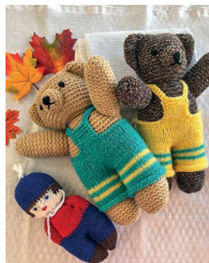
Teddybären für einen guten Zweck

Alles kam gut. Der Reingewinn betrug 1'781 Franken und 35 Rappen. Also mehr als genug, um den Vorschuss für die Standmiete zurückzahlen zu können. 1'000 Franken wurden als Notvorrat auf ein Sparbüchlein gelegt und mit dem Rest konnten die Frauen endlich