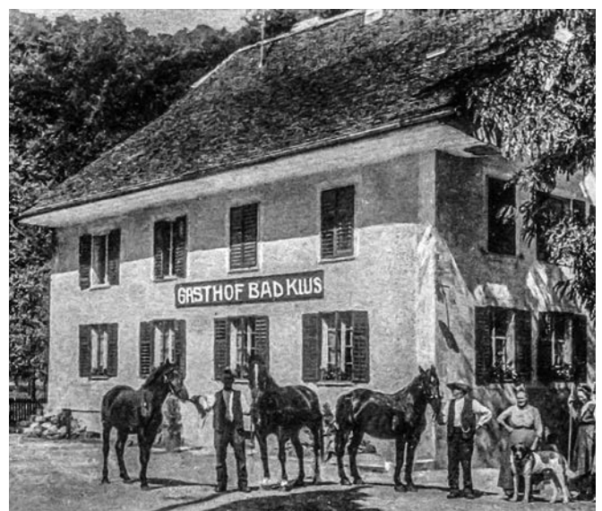
Das Bad Klus um 1918.

«Item Ruodolf Switzer git 5 Schilling vom bad und 5 Schilling tafern.» In diesem Originaltext aus dem Urbar von 1423 wird ein Ruodolf Switzer erwähnt, der Zins für ein Badehaus und eine Taverne bezahlte, wohl der Vorgängerbau des heutigen Bad Klus. Im Urbar von 1518 wird Kleinhans Buri als Besitzer der Gebäulichkeiten erwähnt. Längere Zeit blieben die Taverne und das Badehaus im Besitz der Familie Buri. Im Jahr 1588 ist Hans Müller, Tochtermann (Schwiegersohn) von Oswald Buri, als Besitzer erwähnt. Doch scheint die Wirtschaft laut Quellen durch Liederlichkeit zugrunde gerichtet worden zu sein.