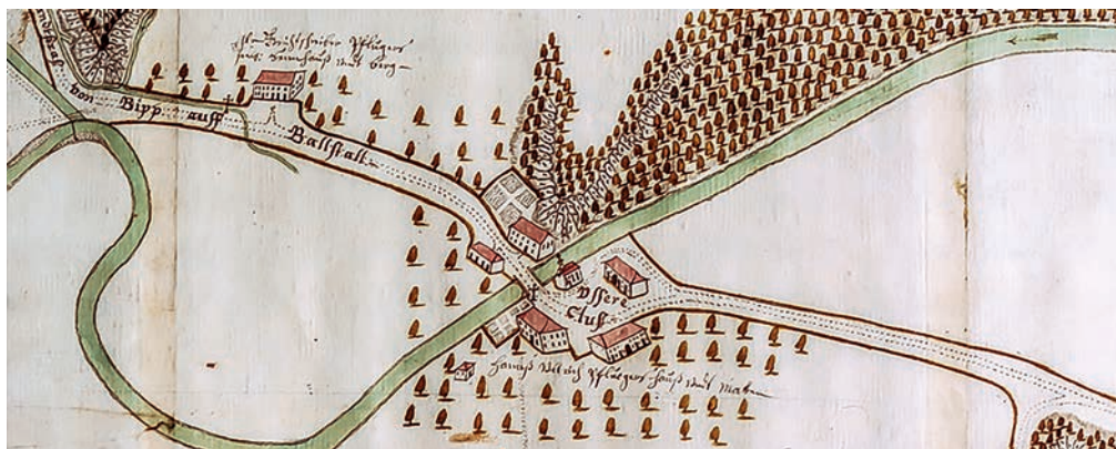
Die erste bekannte bildliche Darstellung der Äusseren Klus. Ausschnitt aus dem Plan «Der Dünner Fluss», gezeichnet von Johann Ludwig Erb im Jahr 1746. Original im Staatsarchiv Solothurn, unter Cn1_01.