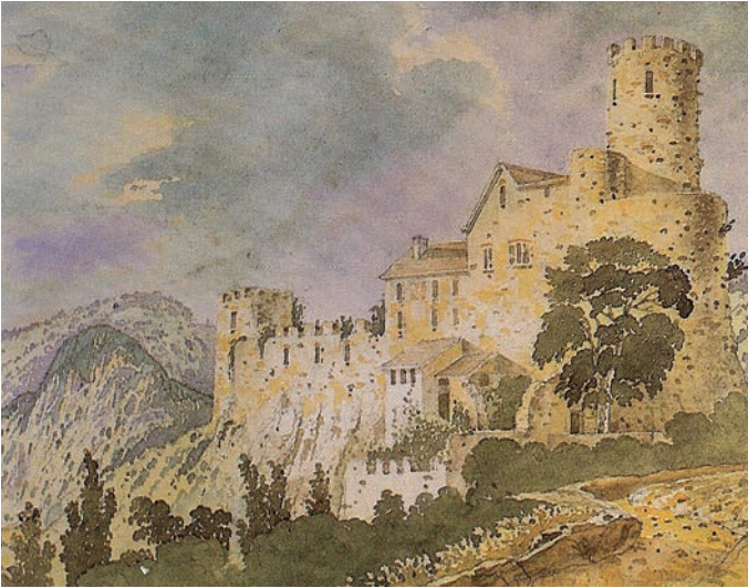
1830, Aquarell von Hans Graff. Zustand beim Kauf durch Johannes Riggensbach, 1835, Landvogtgeden teilweise abgebrochen, Terrasse mit Schiesscharten verziert, Kuonihäuschen und Wehrgang ohne Dach.