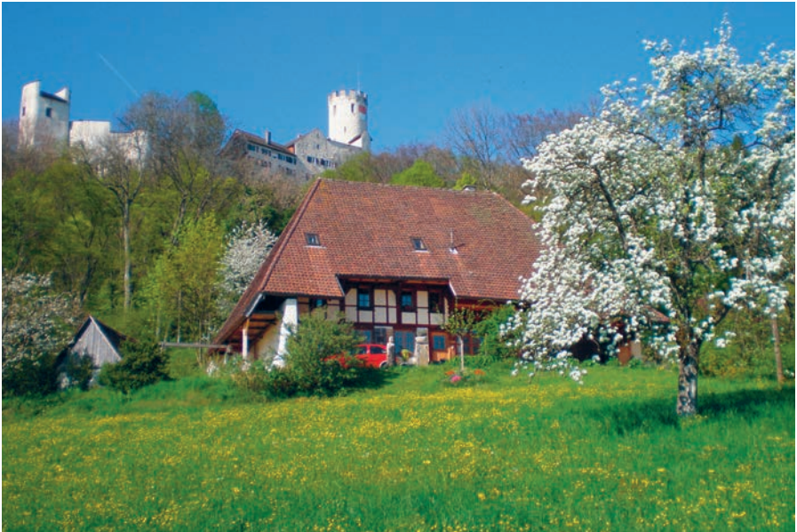
Strohhaus mit Schloss, 2009

Zusammengestellt von Werner Stooss, «Ritter von Bechburg»