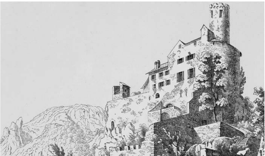
1839, Lithographie von Johann Friedrich Wagner. Kuonihäuschen und Wehrgang wieder gedeckt, kleiner Anbau als Gartenhaus, Schutzbauten bei der Zugbrücke entfernt, Westturm saniert.