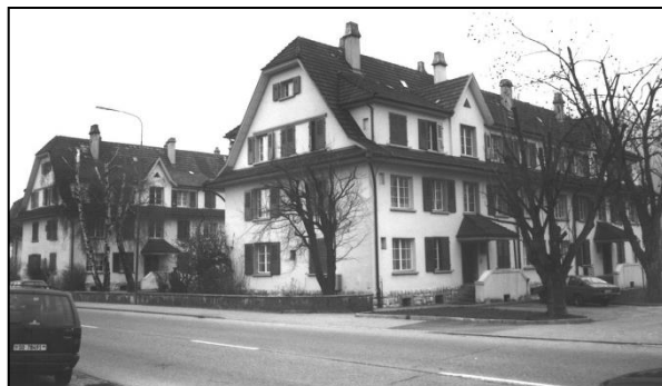
Arbeiterwohnhäuser „Neubauten“, je 12 Wohnungen, 1918