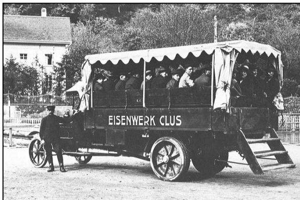
Lastwagentransport für Arbeiter, ca. 1920

Aus der Bevölkerungsstatistik ist zu entnehmen, dass ab 1850 die Einwohnerzahl zurückging. Sie erreichte 1870 den tiefsten Stand. Erst 1888 kletterte sie wieder auf den gleichen Stand wie 1850. Im letzten Viertel des 19. Jh. spielte die Auswanderung noch einmal eine wichtige Rolle. Die Begehren der „Amerikaner“ um Übersendung ihrer zurückgelassenen Vermögen häuften sich. Auf der andern Seite waren mehrere Heimkehrwillige wiederum auf die Unterstützung ihrer Heimatgemeinde angewiesen. Mit grosser Freude wurde 1888 die Spende des Schlossherrn Friedrich Riggerbach von 1'000 Franken in die Armenkasse entgegengenommen.